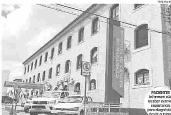
PACIENTES Informam não receber exames importantes para diagnóstico desde outubro

A pós desativação do Centro de Medicina Especializada (Cemesp), no Bairro de Fátima, e extinção do atendimento de urgência e emergência ortopédica e traumatológica da Unidade de Pronto Atendimento (UPA) do Anacajá, desde vez o Governo do Maranhão sobrecarrega pacientes ao atrasar na entrega de resultados de exames de imagem, realizados no Hospital de Câncer Dr. Tanquínio Lopes Filho, localizado na Madre Deus. Mulheres que fizeram o exame de mamografia na unidade, em outubro, por exemplo, ainda não receberam os resultados.