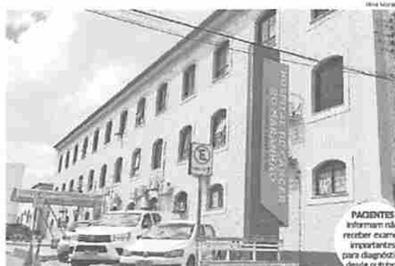
PACIENTES informam não receber exames importantes para diagnóstico desde outubro

A pós desativação do Centro de Medicina Especializada (Cemesp), no Bairro de Fátima, e extinção do atendimento de urgência e ortopedia ortopédica e traumatológica da Unidade de Pronto Atendimento (UPA) do Anapá, desta vez o Governo do Maranhão sobrecarrega pacientes ao atrasar na entrega de resultados de exames de imagem, realizados no Hospital de Câncer Dr. Tarquínio Lopes Filho, localizado na Madre Deus. Mulheres que fizeram o exame de mamografia na unidade, em outubro, por exemplo, ainda não receberam os resultados.