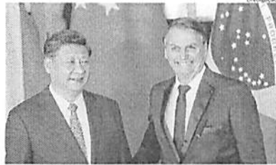
Presidente Chinês, Xi Jinping, assinou acordos com Jair Bolsonaro

Entre os atos assinados hoje estão protocolos sanitários para exportação de pera da China ao Brasil e de melão do Brasil para a China. Também foi firmado um plano de ação na área de agricultura, de 2019 a 2023, nas áreas de políticas agrícolas; inovação científica e tecnológica; investimento agrícola; comércio agri-