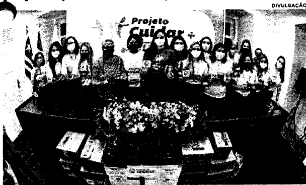
Solenidade de lançamento do projeto Cuidar+, que tem à frente a primeira-dama de São Luís, Graziela Braide

Foi lançado nessa sexta-feira (1º), o projeto Cuidar+. A iniciativa, idealizada pela primeira-dama de São Luís, Graziela Braide, tem como objetivo a realização de ações de âmbito social e educativo, voltadas para a promoção do bem-estar e assistência à população em situação de vulnerabilidade social. A primeira ação do projeto será a arrecadação de absorventes, coletores e tampões menstruais para posterior doação. "O Cuidar+ nasceu da vontade de querer transformar São Luís, por meio de ações concretas, em uma cidade ainda mais humana. A pandemia nos trouxe momentos difíceis e, mais do que nunca, precisamos apoiar aqueles que estão em situação de vulnerabilidade. E essa será a nossa missão com esse projeto, que terá atuação em todas as áreas para cuidar